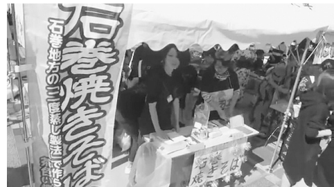
写真5 模擬店（2016年・椋山女学園大学）