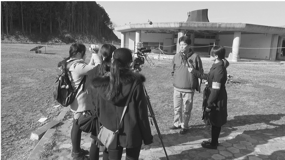
写真1 現地での取材・撮影（2016年・石巻市立大川小学校）