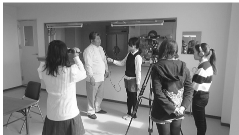
写真4 石巻焼きそば取材（2016年・石巻市）

被災地の取材をきっかけにゼミ学生の自主企画イベントも生まれた。2016年2月に現地取材した学生4人が中心になり、ゼミ学生15人が同年10月に開催された大学祭で「石巻焼きそば」模擬店を出店した。取材で訪問した石巻茶色い焼きそばアカデミーの協力で、石巻のB級ご当地グルメ「石巻焼きそば」を調理して大学祭で販売し、売り上げ金の一部を義援金にしたほか、震災の映像記録を紹介するチラシを配布し、「震災の被災地を忘れないで！」と訴えた。1日＝150食を準備したが昼前には完売して大盛況だった。新聞等で紹介記事が掲載されたほか、当日は中京テレビのニュース取材を受けた。