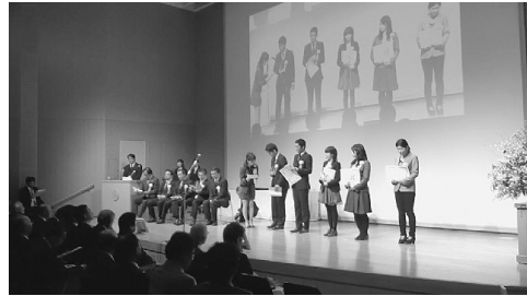
写真3 地方の時代映像祭に参加（2012年）

被災地の取材をきっかけにゼミ学生の自主企画イベントも生まれた。2016年2月に現地取材した学生4人が中心になり、ゼミ学生15人が同年10月に開催された大学祭で「石巻焼きそば」模擬店を出店した。取材で訪問した石巻茶色い焼きそばアカデミーの協力で、石巻のB級ご当地グルメ「石巻焼きそば」を調理して大学祭で販売し、売り上げ金の一部を義援金にしたほか、震災の映像記録を紹介するチラシを配布し、「震災の被災地を忘れないで！」と訴えた。1日＝150食を準備したが昼前には完売して大盛況だった。新聞等で紹介記事が掲載されたほか、当日は中京テレビのニュース取材を受けた。