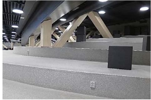
資料3 Oodi2階（フリースペース）