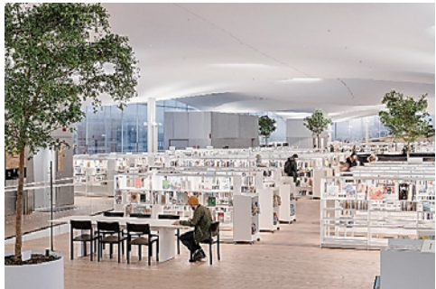
資料5 Oodi3階（書籍棚）