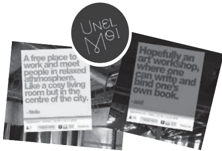
資料10 the Unel-moi! コメント