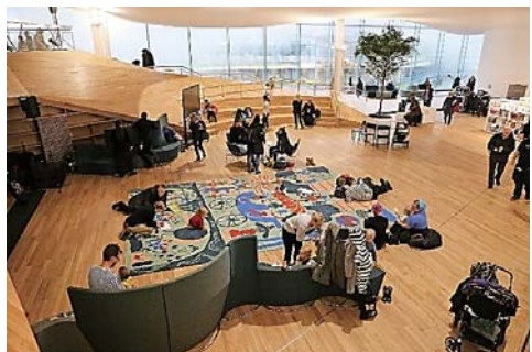
資料7 Oodi3階（南側）

以外のスペースには、イベントスペース（資料7）、ストーリー・ルーム、子ども用施設（児童室）、カフェが併設されている。