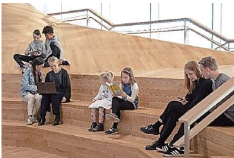
資料6 Oodi3階（北側フリースペース）