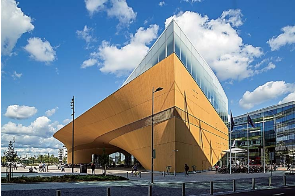
資料1 Oodi外観（正面エントランスは画面左側）