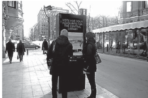
資料11 投票を呼びかける電子パネル