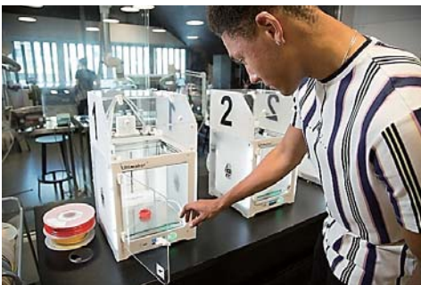
資料4 Oodi2階（ワークステーションの一部） 出所：Oodi 公式HP（Photo: Jonna Pennanen）