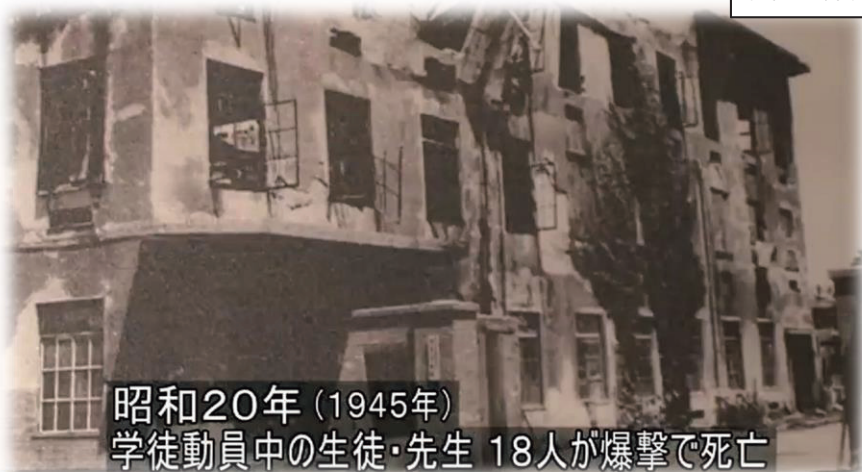
昭和20年（1945年） 学徒動員中の生徒・先生 18人が爆撃で死亡