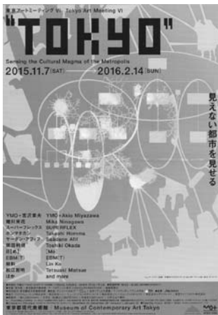
【図2】 い試みではない。しか し、この展覧会の開催