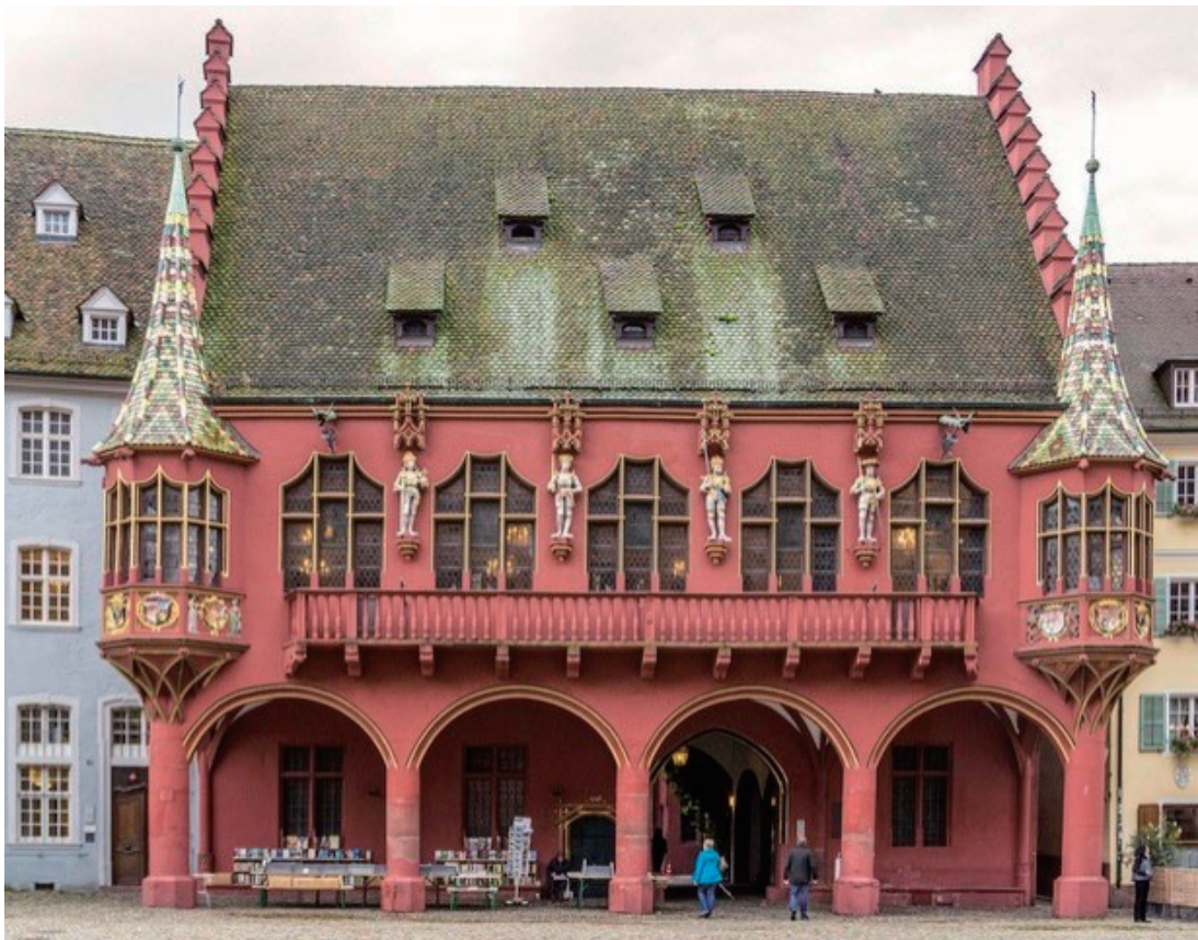
写真2. 国立フライブルク音楽大学大学院 国家演奏家資格試験（博士後期課程相当）公開演奏会を行ったコンサートホール（1984年4月）