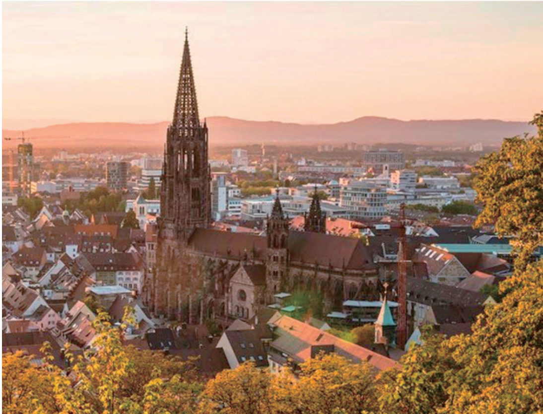
写真1. ドイツ・フライブルク市の教会を臨む（1984年4月）